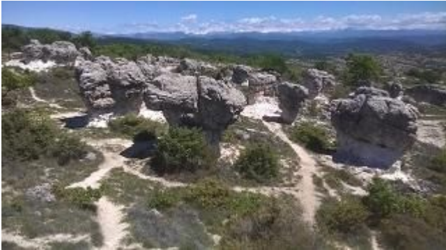
Les Mourres, Forcalquier

* Ce programme peut être modifié selon la météo et niveau. Covoiturage