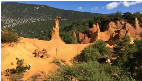
Le Colorado Provençal