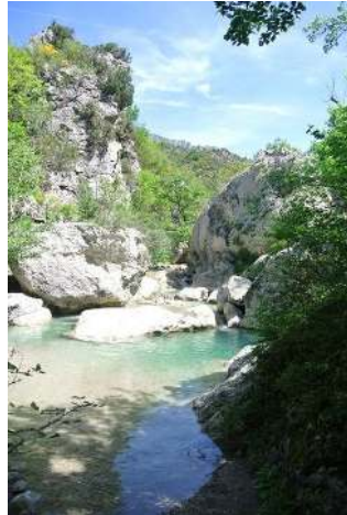
Les Gorges de Trévans